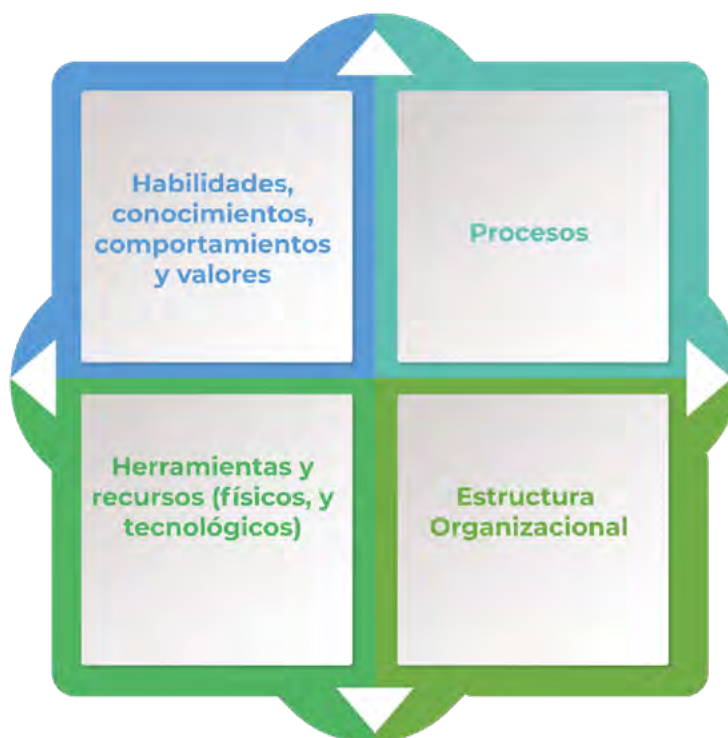
Figura 1. Factores necesarios para desarrollo de las capacidades organizacionales

Las capacidades organizacionales se definen como una colección de rutinas de alto nivel (Dávila, 2013), las cuales requieren de una serie de factores para poder ser constituidas dentro de los cuales se encuentran: habilidades, comportamientos, valores y conocimientos, así como procesos que describan las actividades requeridas para su despliegue, herramientas e insumos físicos y tecnológicos necesarios para la ejecución de las actividades, y finalmente de una estructura organizacional que soporte la capacidad durante su implementación (Figura 1).