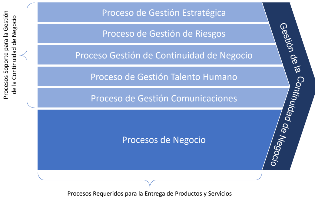
Figura. 2 Procesos para la Gestión de la Continuidad de Negocio

Esta figura toma como referencia el planteamiento de la Cadena de Valor propuesta por (Porter, 1985), identificando los procesos que se requieren para brindar un soporte estratégico al despliegue de las actividades asociadas con la Gestión de la Continuidad de Negocio, así como los procesos requeridos para la entrega de los productos y servicios por parte de la organización. La descripción de cada uno de estos procesos es la siguiente: