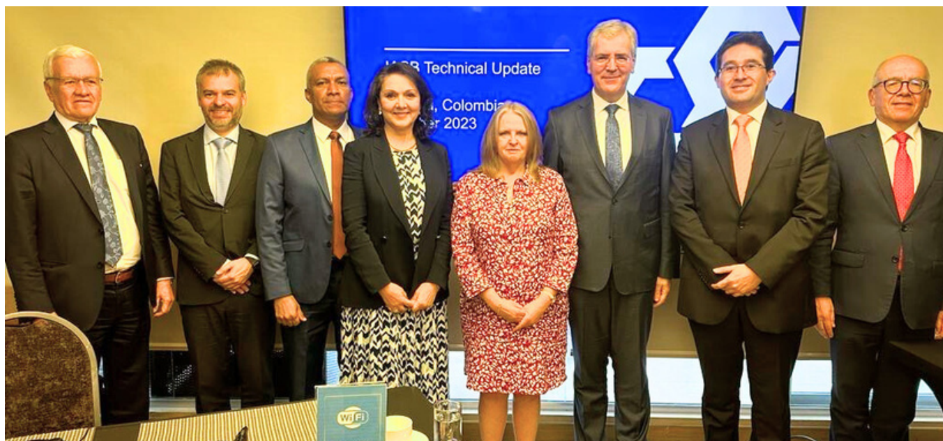
Visita de integrantes del International Accounting Standard Board -IASB- a Colombia, Octubre de 2023.